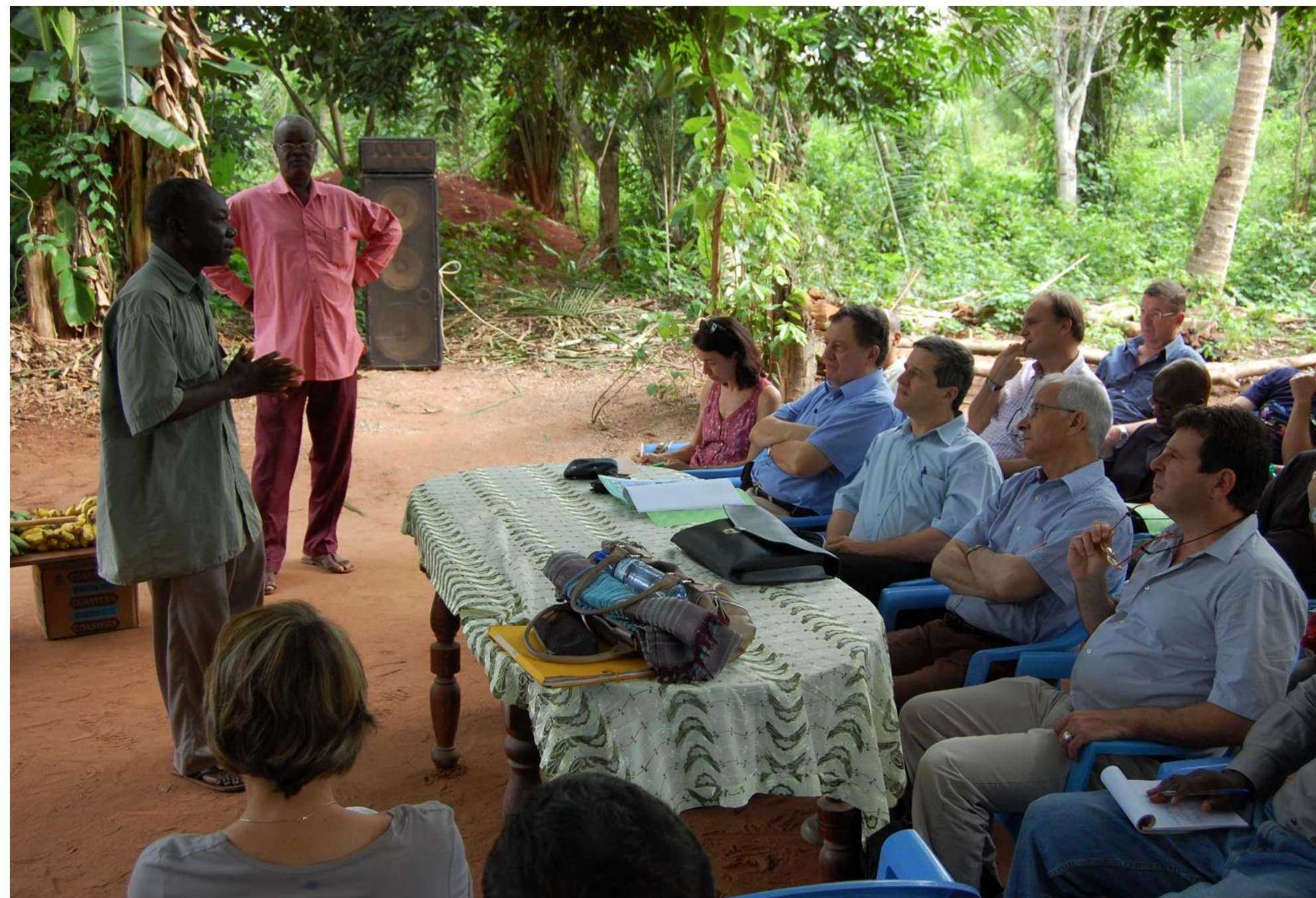
Le Conseil scientifique du Cirad en visite au Bénin - 2013

Ce dispositif peut être aisément transposable à d'autres comités institutionnels.